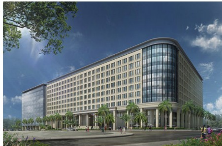
複合施設完成イメージ

Total cost: 37.7b JPY (Jp public & private sectors to bear 80%)