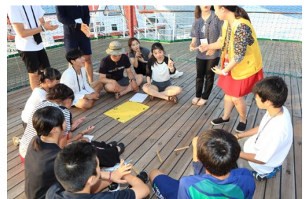
韓国文化紹介で韓国の伝統的な遊びを教わる。

また、韓国環境財団の協力で行った、環境保全を考えるプログラムでは、東アジアという視点で環境を考える事によって、より身近に問題を捉える事ができました。さらに、個人レベルでは大きな改善は難しい問題も、近隣諸国と協力すれば大きな成果が得られるということを知りました。環境問題は、世界規模で深刻なレベルにあると言えますが、次の世代を引き継ぐ彼らが、問題をアジアという規模で考え始める事ができました。