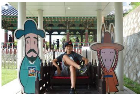
朝鮮通信史歴史館にて。

朝食後、初寄港地の韓国・釜山の港のターミナルに足を踏み入れる。子どもたちは「歴史散歩～日本と韓国のつながりを感じる」ツアーに参加。朝鮮通信歴史館の見学では、朝鮮半島から日本に伝わった、文化・芸術・食べ物などを学ぶ。その後、釜山の人の憩いの場所である竜頭山公園を散策しお土産時間。少し辛い韓国料理体験後、オーシャンドリーム号に戻ると、釜山から乗船した多くの韓国人乗客の姿。盛大な出港式が行われた。