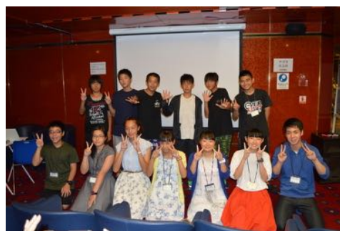
福島紹介を終えてほっとするメンバー。一人一人がしっかりと発表しました。

洋上最後の日。大きな発表が2つ行われた。韓国と日本の文化の大披露会である「日韓文化交流会」で、乗船してから毎日練習してきたソーラン節の発表。フェイスペイントをして、福島と熊本とブラジルのみんなで踊る。大迫力の演技に大きな喝采が上がった。午後は、福島紹介企画。福島の名物などを発表し、一人一人が想いを伝える福島の子もたち。暖かい拍手に、子たちも達成感を感じた。