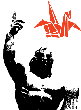
Sculpture at Nagasaki Peace Park

Además, muchos de los Hibakusha japoneses emigraron posteriormente a países como los EE.UU., Canadá y Brasil. Estos Hibakusha no reunían los requisitos para recibir asistencia del gobierno japonés hasta que tuvieron éxito en una demanda reciente para recobrar sus derechos.